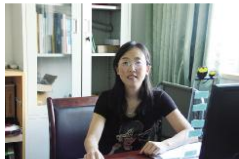
格言：严于律己，勤于生活，身正为范，以德感人。

对于提高学生的兴趣，柴老师认为，可以从两个方面着手。一方面是教学方法，采用多种教学方法结合，而不是纯讲授的“填鸭式”教学。同时平时表现结合到我们的第二课堂中去，比如说工程结构课程的学习，课内实验可以通过混凝土的配合比设计、梁钢筋的设计与制作、加载结果的分析等方面考察学生对课程知识的掌握程度，同时作为选拔参加全国混凝土设计大赛的依据，以提高学生的兴趣和积极性；另一方面